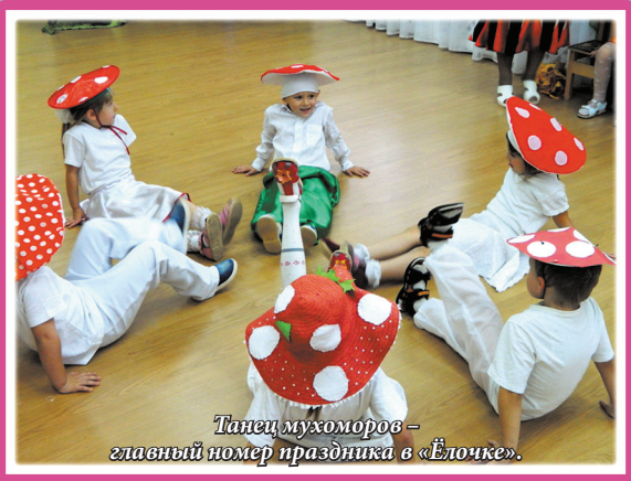
Танец мухоморов – главный номер праздника в «Ёлочке».

И какой хороший праздник получился! За окном было сыкатно и холодно, а в зале царила тёплая, доброжелательная атмосфера. Мальчишки и