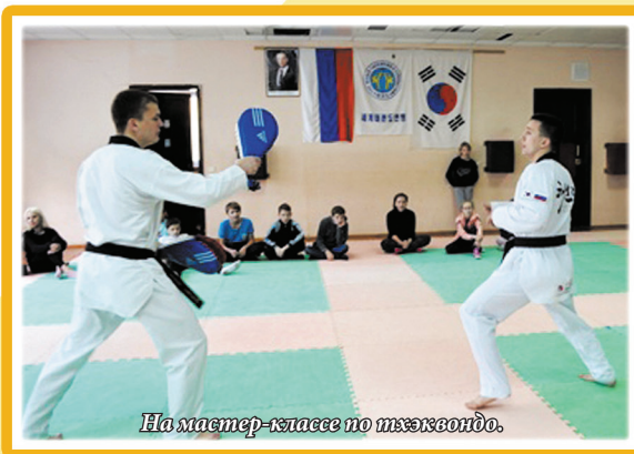
На мастер-классе по тхэквондо.

Мне и остальным ребятам довелось побывать