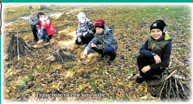
Туристы усебя во дворе.