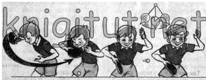
Рис. 16. Подача «маятник» ладонной стороной ракетки